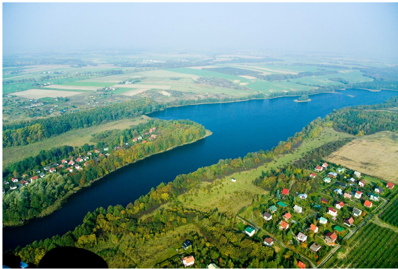
Malowniczo położone zabudowania nad jeziorem

Wierzchucinek to bardzo malowniczo położona miejscowość. Jest samodzielnym Sołectwem położonym w północnej-wschodniej części Gminy Sicienko, która administracyjnie wchodzi w skład powiatu bydgoskiego w województwie kujawsko-pomorskim.