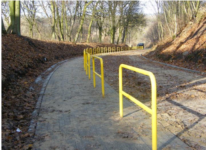
Droga wiodąca nad Jezioro

Wierzchucinek to przede wszystkim Rodzinne Ogrody Działkowe. Wokół jeziora usytuowane są tereny rekreacyjne Ogrodów Działkowych „Delfin”, „Podkowa”, „Półwysep”, „Relax”, „Rusalka”.