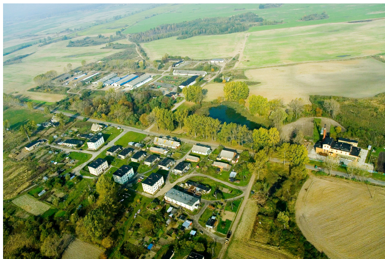
Teresin „z lotu ptaka”

Funkcjonuje tu także Szkoła Podstawowa im. Ziemi Krajeńskiej. W 2000 roku oddano do użytku salę gimnastyczną. Działa tu także dobrze wyposażona siłownia. Przy Szkole w Samsiecznie tworzona jest świetlica wiejska.