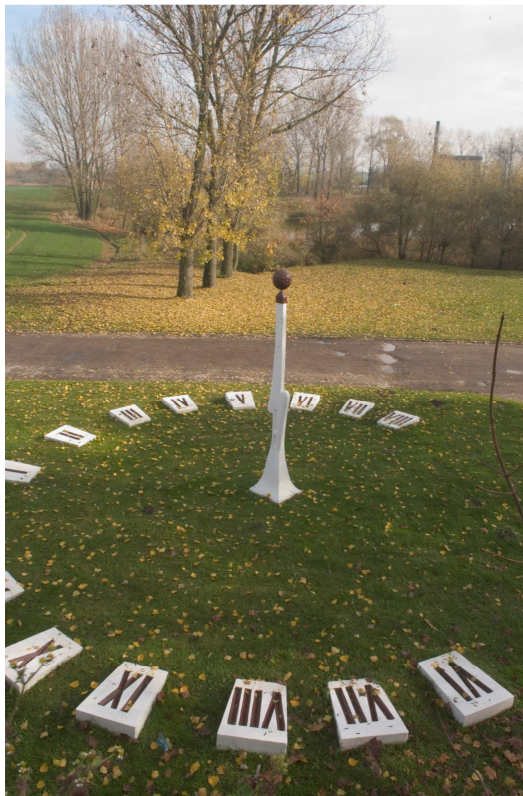
Zegar słoneczny w Teresinie