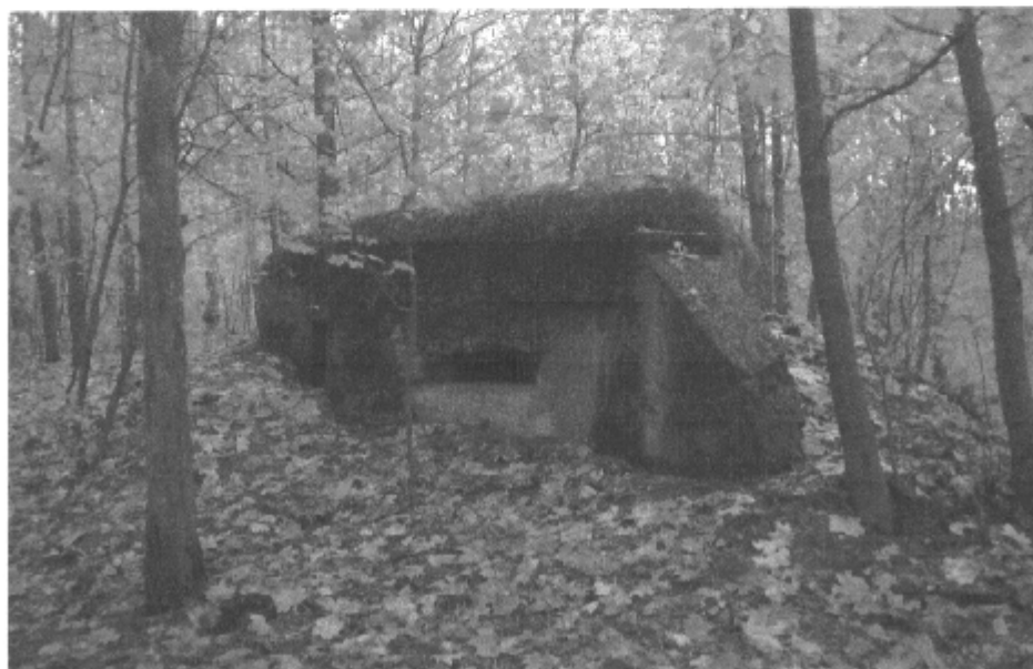
Schron z 1939 r. znajdujący się na trasie szlaku turystycznego Umocnień Przedmościa Bydgoskiego

Przez tereny sołectwa przebiega linia umocnień Przedmościa Bydgoskiego. Do dzisiaj można zobaczyć 7 schronów zbudowanych w sierpniu 1939 r. według instrukcji saperskiej. Kompleks, w sumie 17 schronów wzdłuż linii Zielonczyn, Kruszyn, Osówek, Szczutki, Tryszczyn, wznosiły jednostki bydgoskiego garnizonu: 61 i 62 Pułk Piechoty, 15 Pułk Artylerii Lądowej i Batalion Obrony Narodowej Bydgoszczy. Oddziały te, wspomagane przez 59 Pułk Piechoty z Inowrocławia, broniły wspomnianych pozycji, do czasu odwrotu w nocy z 3 na 4 września 1939 r.