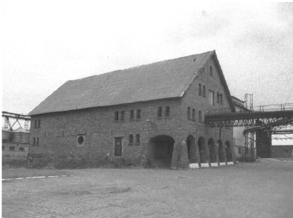
Spichlerz w Osówcu

Plan ten został przedstawiony do akceptacji mieszkańcom miejscowości Osówek na Zebraniu Wiejskim dnia 21 maja 2008 roku, gdzie został zaakceptowany i przyjęty uchwałą. Kolejne Zebranie Wiejskie z dnia 16 lutego 2009 roku przyjęło uchwałą proponowane przez Grupę „Odnowa wsi” zmiany aktualizacyjne Planu, dotyczące przede wszystkim harmonogramów oraz kosztorysu prac.