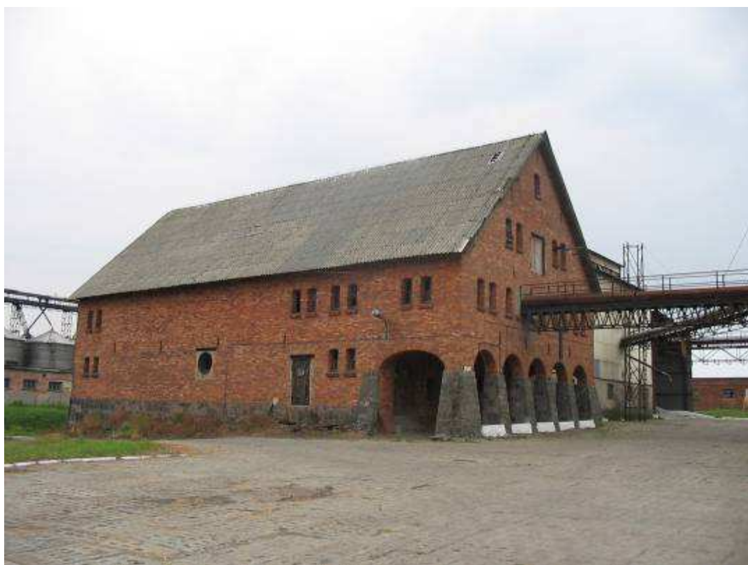
Spichlerz w Osówcu

Plan ten został przedstawiony do akceptacji mieszkańcom miejscowości Osówiec na Zebraniu Wiejskim dnia 21 maja 2008 roku, gdzie został zaakceptowany i przyjęty uchwałą.