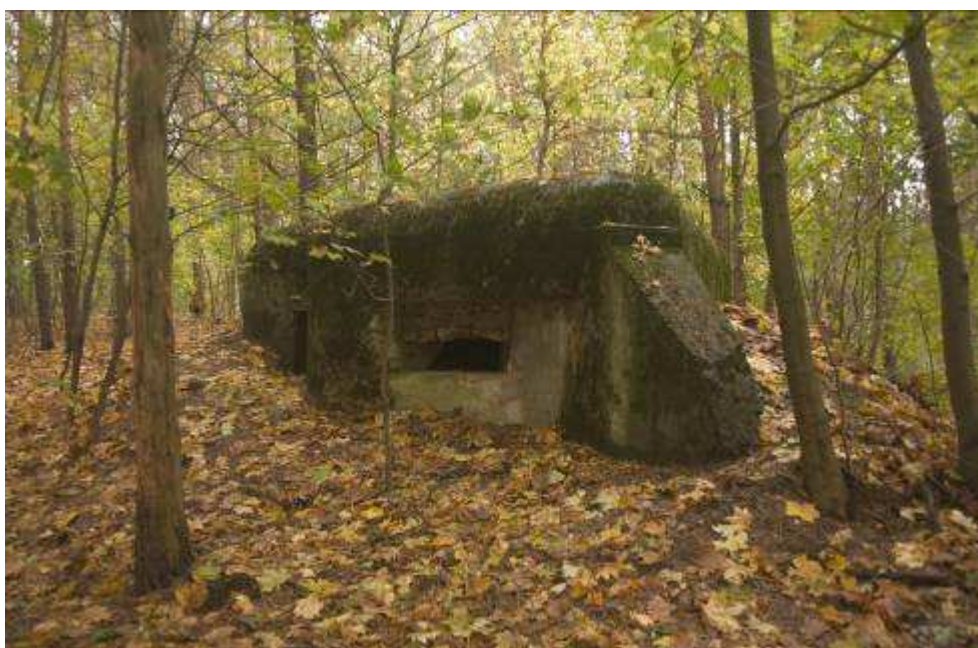
Schron z 1939 r. znajdujący się na trasie szlaku turystycznego Umocnień Przedmościa Bydgoskiego

Przez tereny sołectwa przebiega linia umocnień Przedmościa Bydgoskiego. Do dzisiaj można zobaczyć 7 schronów zbudowanych w sierpniu 1939 r. według instrukcji saperskiej. Kompleks, w sumie 17 schronów wzdłuż linii Zielonczyn, Kruszyn, Osówiec, Szczutki, Tryszczyn, wznosiły jednostki bydgoskiego garnizonu: 61 i 62 Pułk Piechoty, 15 Pułk Artylerii Lądowej i Batalion Obrony Narodowej Bydgoszczy. Oddziały te, wspomagane przez 59 Pułk Piechoty z Inowrocławia, broniły wspomnianych pozycji, do czasu odwrotu w nocy z 3 na 4 września 1939 r.