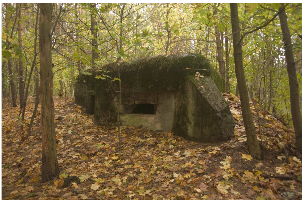
Schron z 1939 r. znajdujący się na trasie szlaku turystycznego Umocnień Przedmościa Bydgoskiego

Przez tereny sołectwa przebiega linia umocnień Przedmościa Bydgoskiego. Do dzisiaj można zobaczyć 7 schronów zbudowanych w sierpniu 1939 r. według instrukcji saperskiej. Kompleks, w sumie 17 schronów wzdłuż linii Zielonczyn, Kruszyn, Osówiec, Szczutki, Tryszczyn, wznosiły jednostki bydgoskiego garnizonu: 61 i 62 Pułk Piechoty, 15 Pułk Artylerii Lądowej i Batalion Obrony Narodowej Bydgoszczy. Oddziały te, wspomagane przez 59 Pułk Piechoty z Inowrocławia, broniły wspomnianych pozycji, do czasu odwrotu w nocy z 3 na 4 września 1939 r.