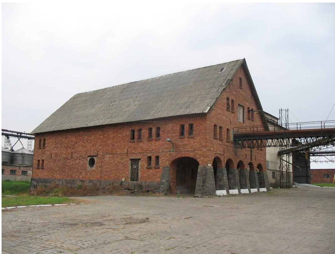
Spichlerz w Osówcu

Plan ten został przedstawiony do akceptacji mieszkańcom miejscowości Osówiec na Zebraniu Wiejskim dnia 21 maja 2008 roku, gdzie został zaakceptowany i przyjęty uchwałą.