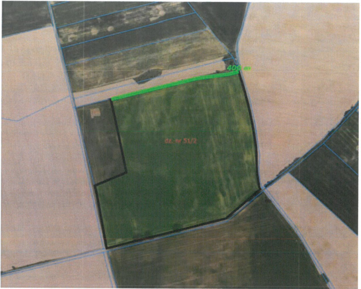
Rysunek 1. Plan nasadzeń zieleni izolacyjnej (zielona pogrubiona linia) zgodny z uzupełnieniem raportu z dnia 30.06.2022 r. (wpływ: 04.07.2022 r.)