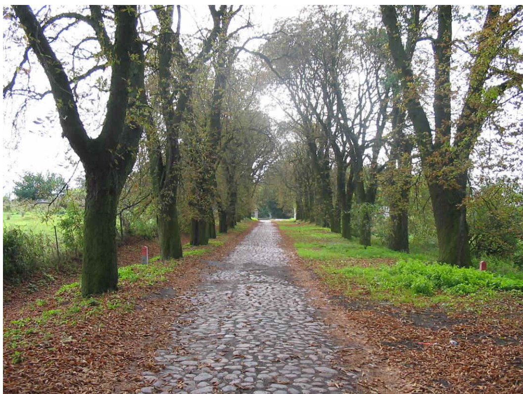
Aleja kasztanowa w Strzelewie

Plan ten został przedstawiony do akceptacji wszystkim mieszkańcom miejscowości Strzelewo na Zebraniu Wiejskim dnia 19 lipca 2007 r., gdzie został zaakceptowany i przyjęty uchwałą.