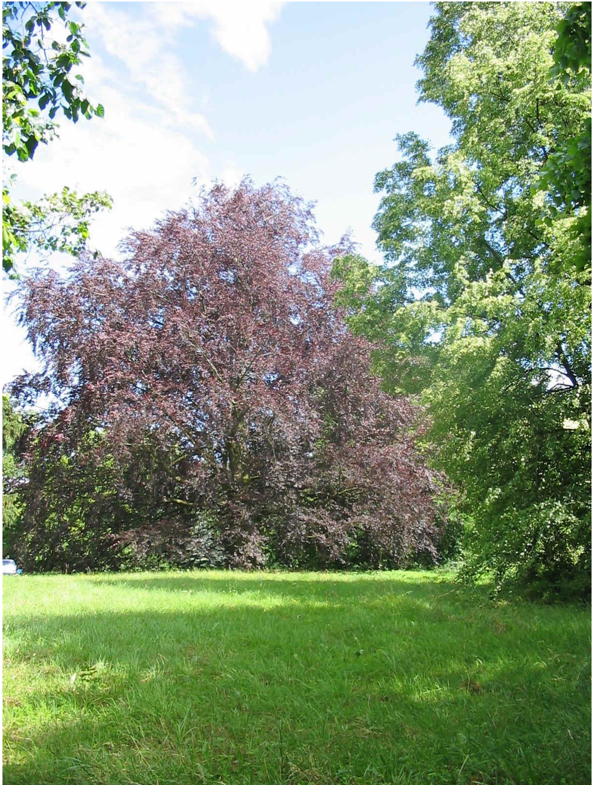
Buk pospolity formy czerwonej