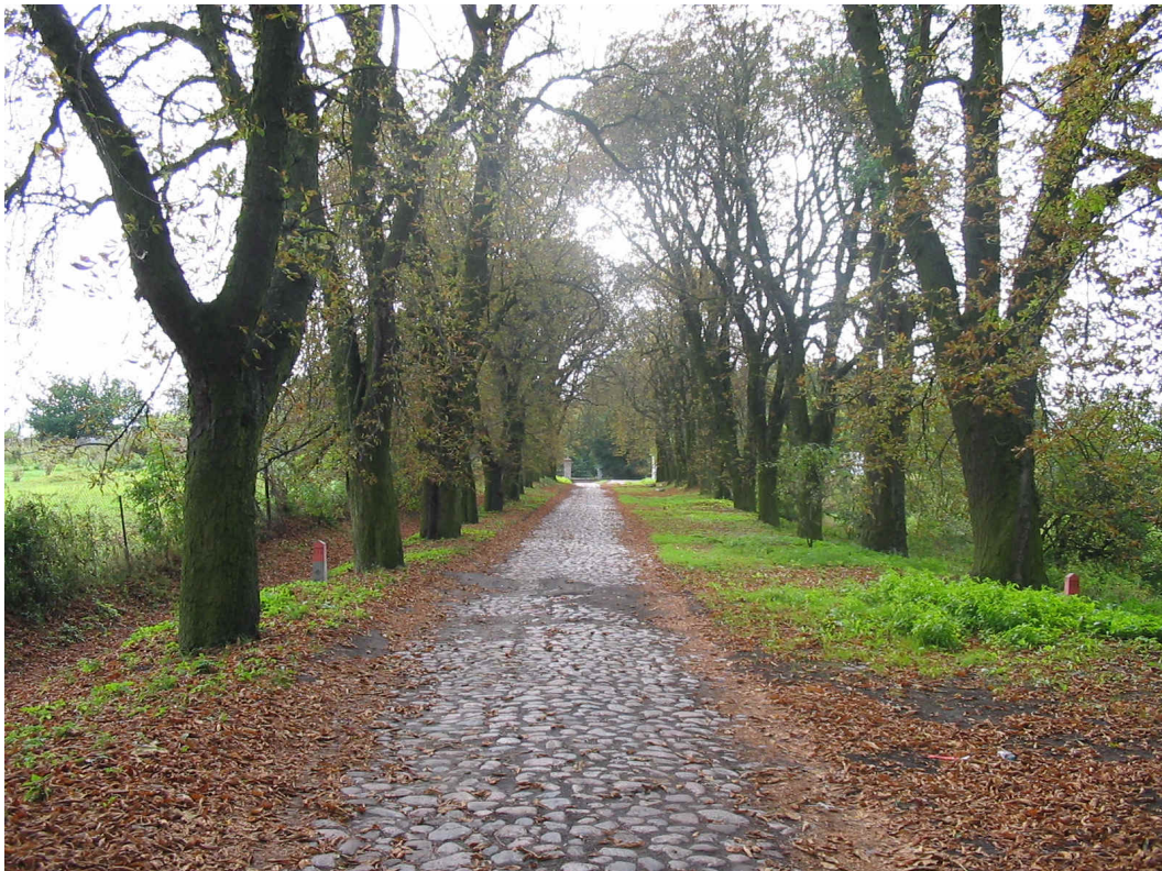
Aleja kasztanowa w Strzelewie

Plan ten został przedstawiony do akceptacji wszystkim mieszkańcom miejscowości Strzelewo na zebraniu wiejskim, gdzie został zaakceptowany bez zastrzeżeń.