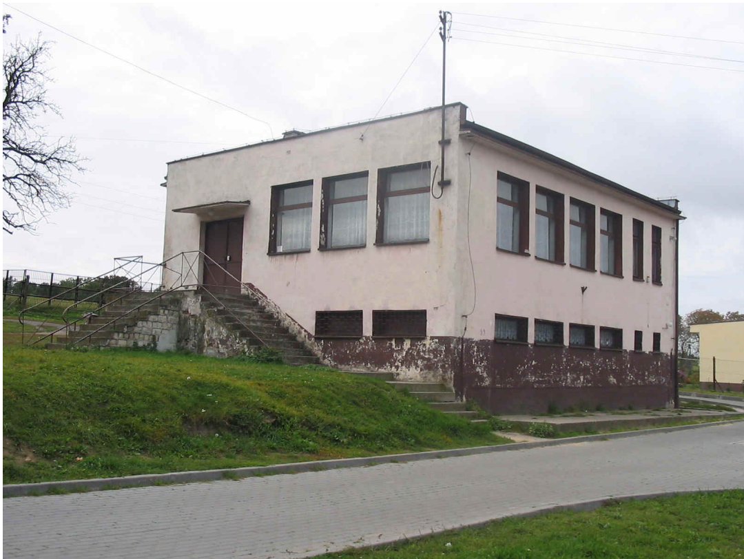
Budynek komunalny do zaadaptowania na świetlicę wiejską