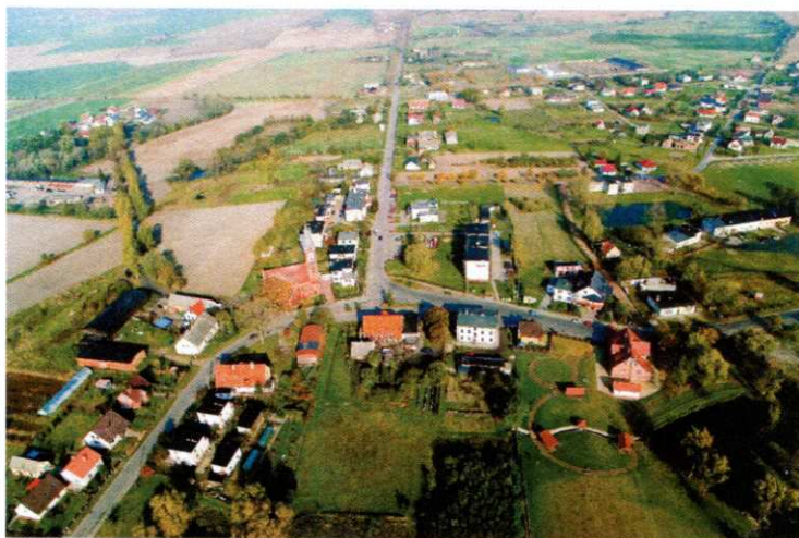
Główna część Sicienka z lotu ptaka

Sicienko położone jest niemal w centrum Gminy, do którego można dojechać drogami powiatowymi Trzemiętówko – Sicienko (ul. Mrotecka) i Samsiecznynek – Wojnowo (ul. Nakielska i ul. Bydgoska). Jego zabudowania ciągną się również wzdłuż asfaltowych i gruntowych dróg gminnych. Graniczy bezpośrednio z 6 innymi