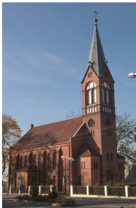
Kościół p.w. św. Andrzeja Boboli w Sicienku

W centrum Sicienka stoi kościół pod wezwaniem św. Andrzeja Boboli wybudowany w 1887 r. dla gminy ewangelickiej według typowego projektu pruskiego. Kościół nieorientowany - prezbiterium skierowane jest na zachód. Zbudowany został w stylu neogotyckim. Jak wspomina kronika parafialna, parafia ewangelicka w Sicienku została utworzona w 1856 r. Początkowo korzystała z budynków tymczasowych. W 1870 r. wzmogła się polityka germanizacyjna. Rząd niemiecki nie