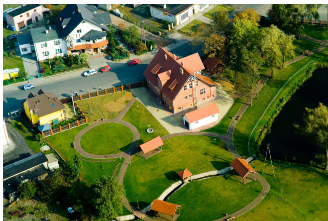
Izba Tradycji Kulturalnej przy ul. Bydgoskiej z otaczającym ją parkiem

Mieści się w nim Galeria Sztuki, w której co kwartał organizowane są wystawy znanych bydgoskich artystów. Odbywają się tam też wystawy ozdób świątecznych wykonanych przez mieszkańców Gminy, wystawiano też fotografie w ramach Konkursu fotograficznego „Cztery pory roku w gminie Sicienko” wykonane przez lokalnych miłośników przyrody. W budynku