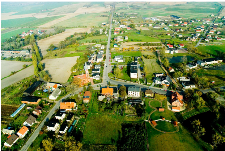
Główna część Sicienka z lotu ptaka

Sicienko położone jest niemal w centrum Gminy, do którego można dojechać drogami powiatowymi Trzemiętówko – Sicienko (ul. Mrotecka) i Samsiecznynek – Wojnowo (ul. Nakielska i ul. Bydgoska). Jego zabudowania ciągną się również wzdłuż asfaltowych i gruntowych dróg gminnych. Graniczy bezpośrednio z 6 innymi