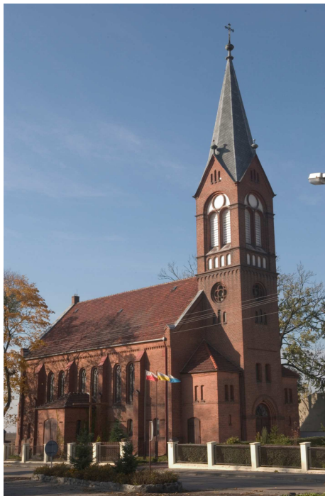
Kościół p.w. św. Andrzeja Boboli w Sicienku

W centrum Sicienka stoi kościół pod wezwaniem św. Andrzeja Boboli wybudowany w 1887 r. dla gminy ewangelickiej według typowego projektu pruskiego. Kościół nieorientowany - prezbiterium skierowane jest na zachód. Zbudowany został w stylu neogotyckim. Jak wspomina kronika parafialna, parafia ewangelicka w Sicienku została utworzona w 1856 r. Początkowo korzystała z budynków tymczasowych. W 1870 r. wzmogła się polityka germanizacyjna. Rząd niemiecki nie